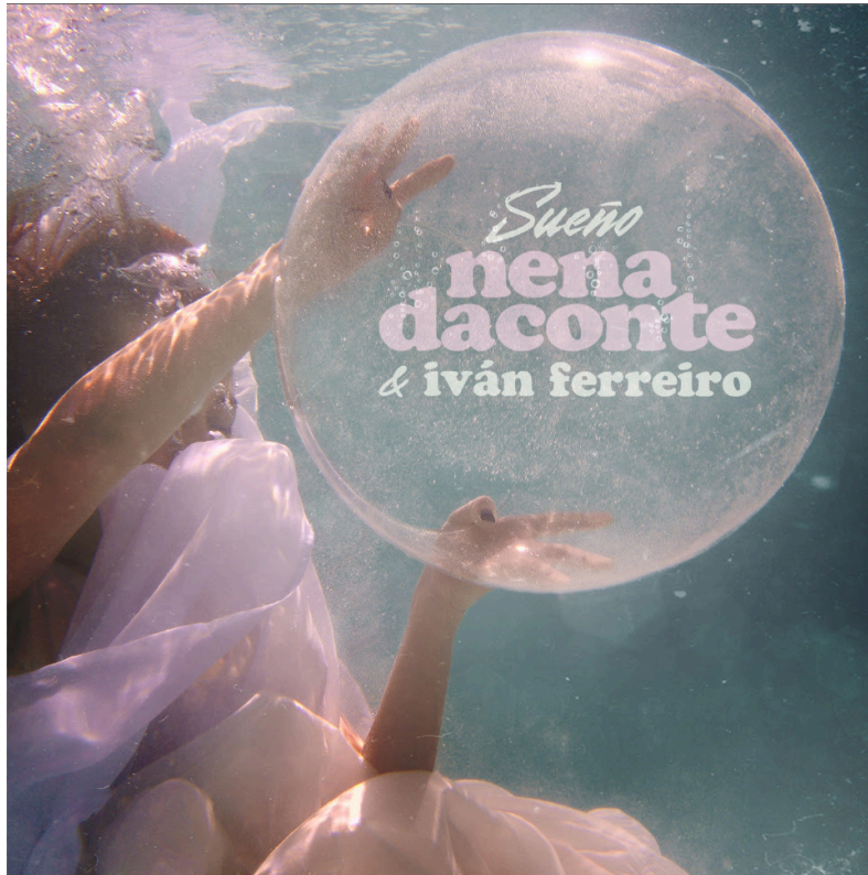
Portada del single "Sueño". Fotografía de Óscar Lafox y diseño de Borja Bonafente

"Sueño" es el tercer single de adelanto de su nuevo disco: "La Escafandra" Iván Ferreiro colabora en la canción aportando las sensaciones de ensoñación que Nena Daconte quería reflejar en este corte del disco