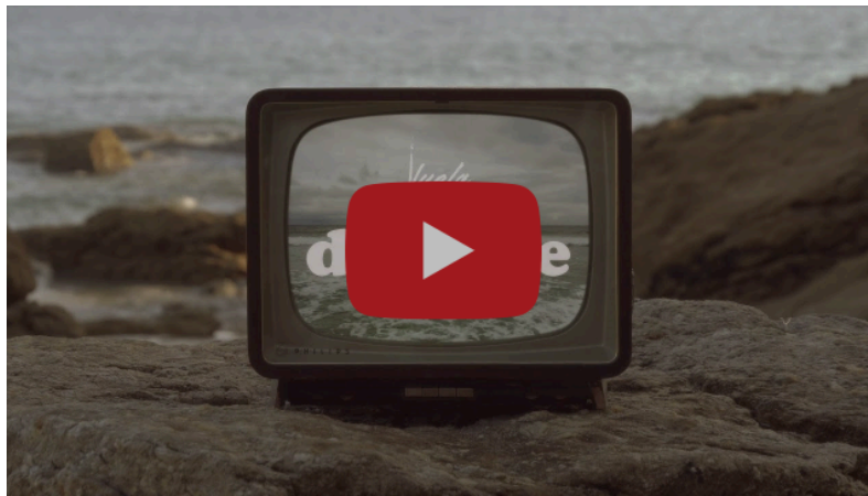
Videoclip de "Vuela" por Óscar Lafox. Primer single del nuevo disco de Nena Daconte "La Escafandra"